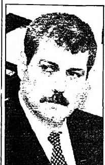
الملك الحسين بن طلال

عمان - القدس العربي: حقق رئيس الوزراء الأردني رقم قياسي جديد في أصوات الثقة البرلمانية، تفوق وحطم الرقم القياسي السابق. وتعد هذه النتيجة من بين أخطر النتائج التي شهدتها الأردن في السنوات الأخيرة.